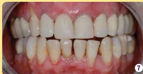
PPP seule 09/2005