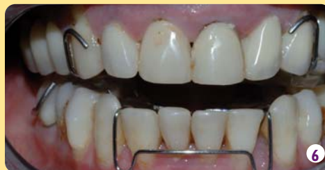
Pose des PPP en 07/2005