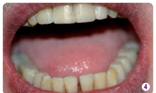
Le même jour, 21 heures