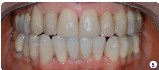
photo n°5 : 20/03/2006 à 18h17

L'utilisation conjointe de l'APF permet de garder des contacts occlusaux cohérents et donc de « rester en contact » avec soi.