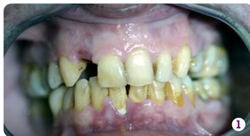
9 heures du matin