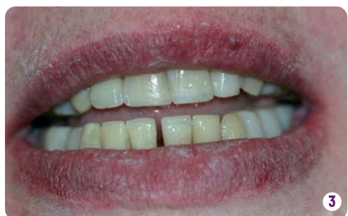
Le même jour, 21 heures